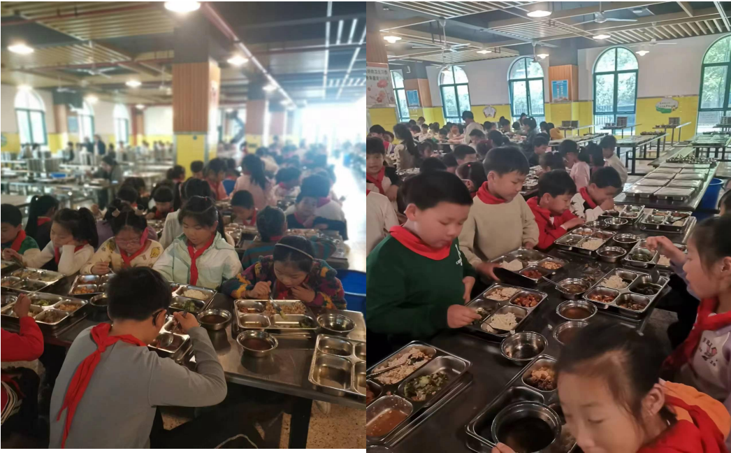
家长验菜实景照片